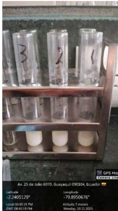
Anexo 5. Procesamiento de muestras prueba de alcohol.