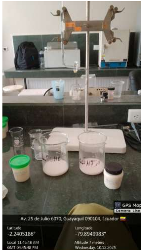
Anexo 7. Procesamiento de muestra prueba de grados Dormic.