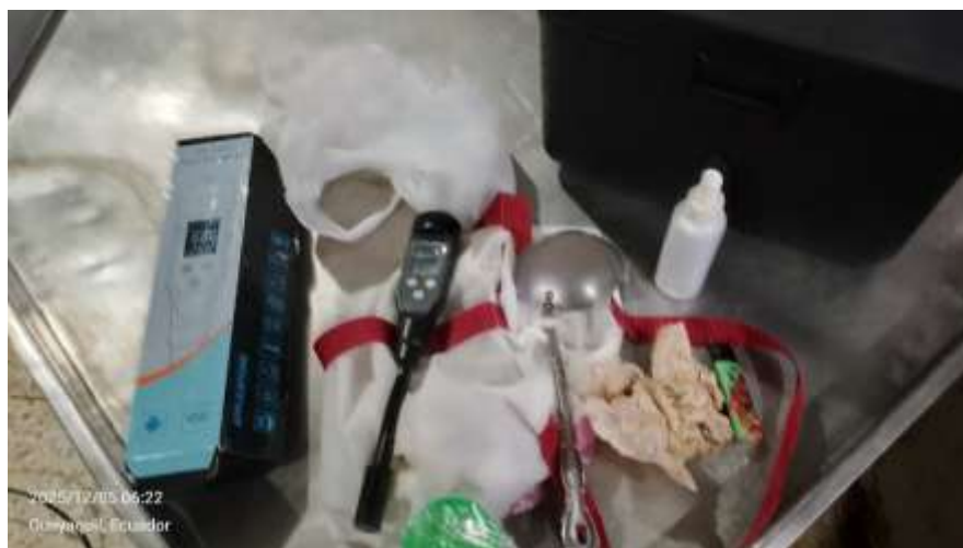
Anexo 2. Materiales para la toma de muestras.