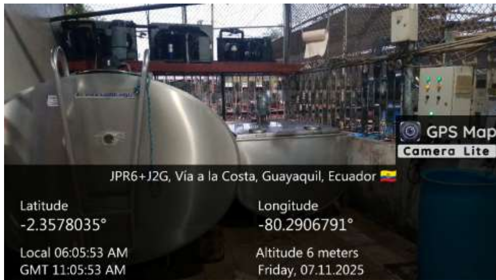
Anexo 3. Sala de tanques de recolección.