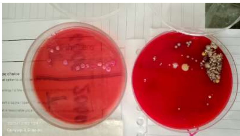
Anexo 8. Resultado de prueba de cultivo.