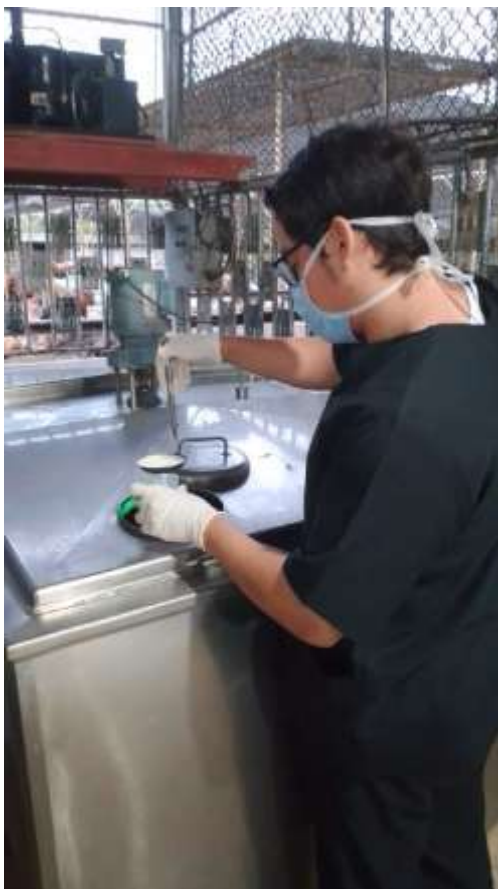
Anexo 1. Recolección de muestra de leche.