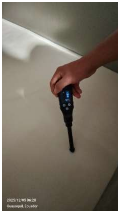
Anexo 4. Toma de Ph de la leche directamente del tanque.